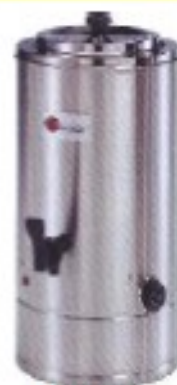
KLAXON T 8