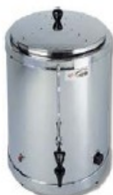
CAMPEONA TL 29