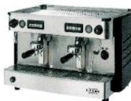
L'ANNA 2G ELECTRONICA